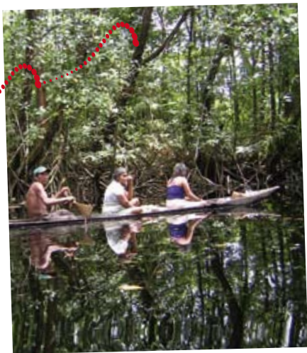
Profitieren Sie von begeisterten Mitarbeitenden!